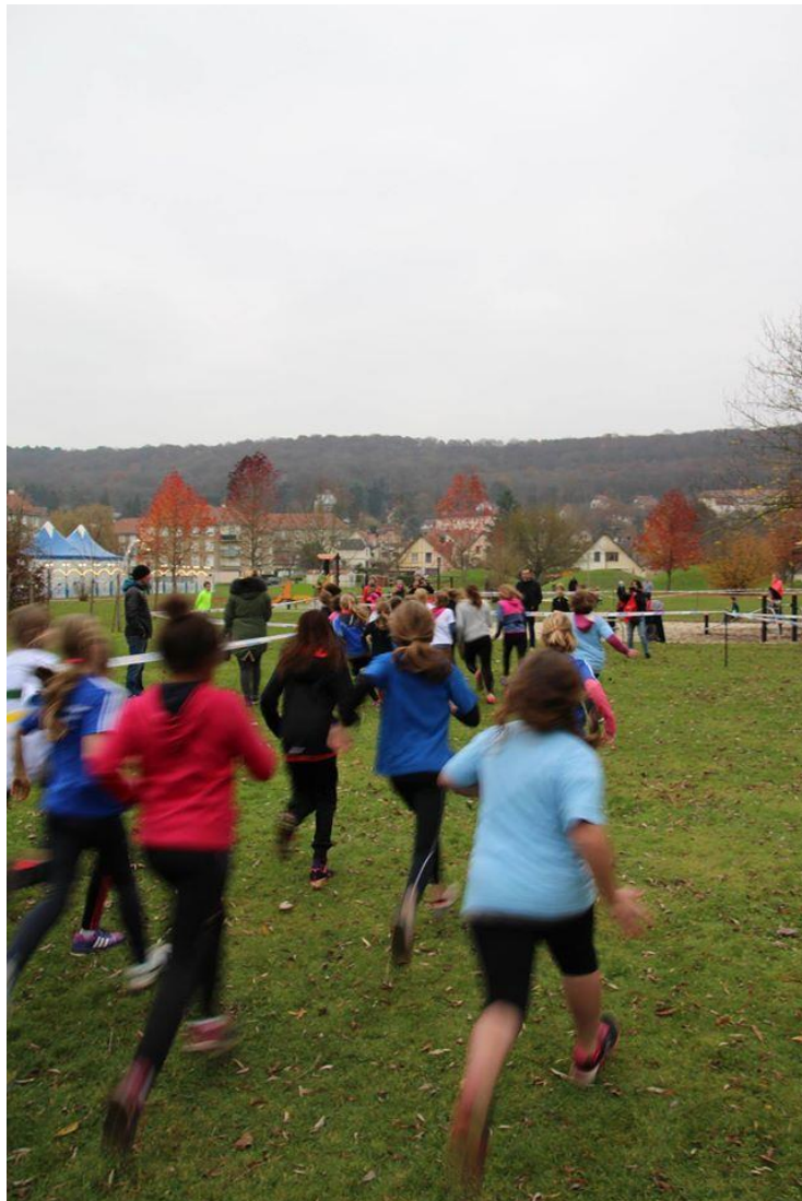
Les jeunes athlètes lancées dans la course