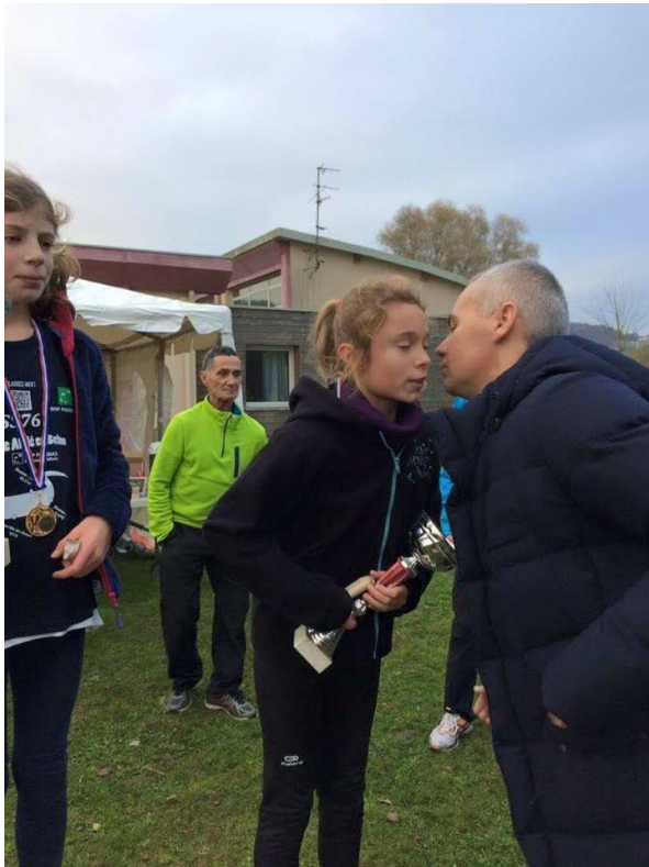
Notre Député Christophe BOUILLON

Cette compétition s'est déroulée sous un ciel clément et en présence de Monsieur BOUILLON Christophe député de la 5 ème circonscription et Rachid Chekhemani qui ont assistés à la remise des récompenses.