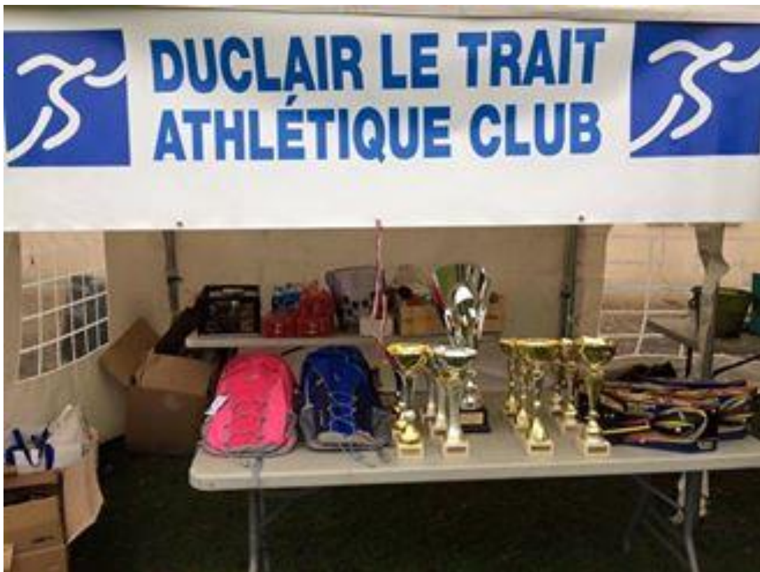
Les coupes et médailles attendent nos athlètes

Samedi 26 novembre le club d'athlétisme Duclair Le Trait –DLTAC – organisait une étape du Challenge Athlé en Seine un cross. Cette épreuve était réservée aux jeunes athlètes de 5 à 11 ans regroupés en microbes, éveil athlé, mini poussin et poussin. Regroupant les clubs du stade Sottevillais 76, EAPE (plateau est), le CORE (Elbeuf), EMSAM (Maromme, Mont Saint Aignan) avec la participation de 250 athlètes.