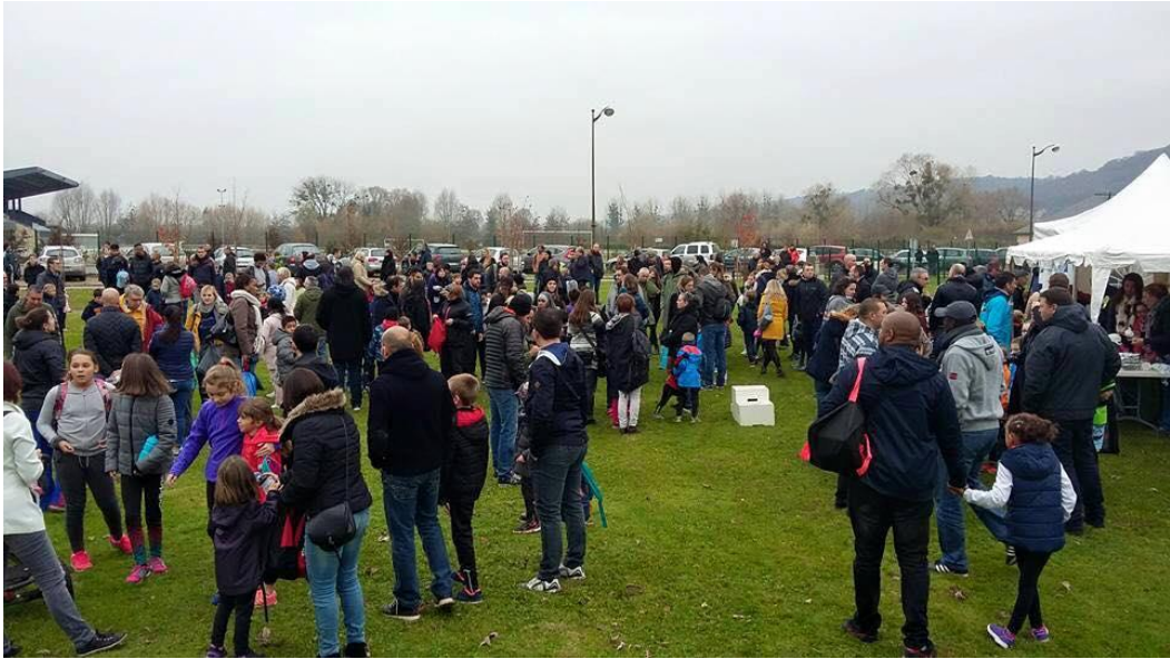
Le public dans l'attente du début du challenge.